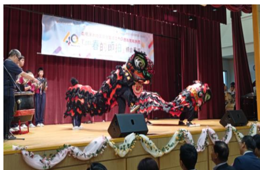
獅藝隊於「深水埗文藝協會成立40周年開幕典禮」中表演

學校會透過不同的平台去展示學生的學習成果，以培養學生的自信心及對學校的歸屬感，如舉辦四邑舞台、才藝匯演、學生成果展及安排學生於開放日、畢業禮、社區活動等表演，並邀請嘉賓及家長出席。而各項活動完成後，學校會於學校網頁發布活動照片，讓家長及外界認識本校的活動情況。