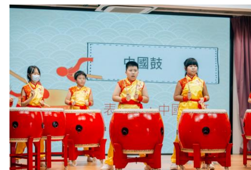
中國鼓班學生於60周年開放日表演