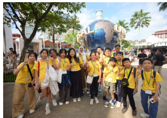
新加坡英語文化體驗及STEAM學習之旅