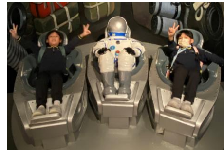
常識科戶外學習日