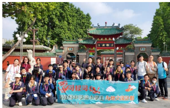
同根同心「佛山嶺南文化高鐵之旅」

除了平日的課外活動外，我們為學生安排了與國民教育或價值觀教育相關的活動、境外交流活動、校外學習活動、四至六年級教育營、各類參觀活動、一人一花計劃、常識科戶外學習日、藝術文化體驗活動、陸運會等不同的學習機會。