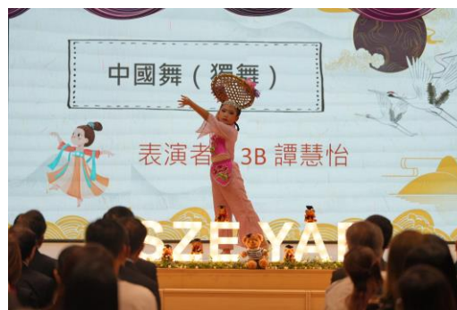
中國舞班學生於畢業禮中表演